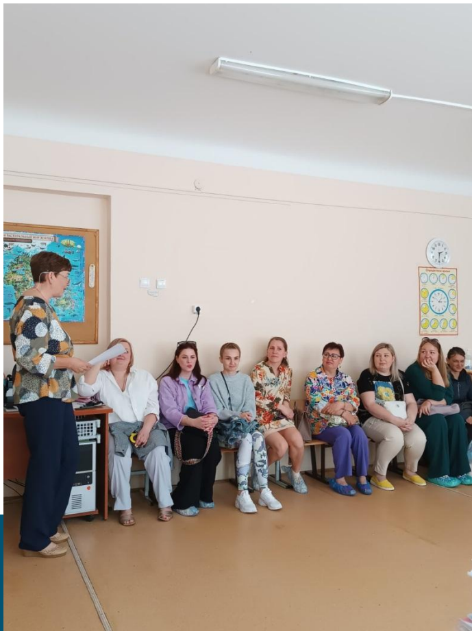
Дни открытых дверей