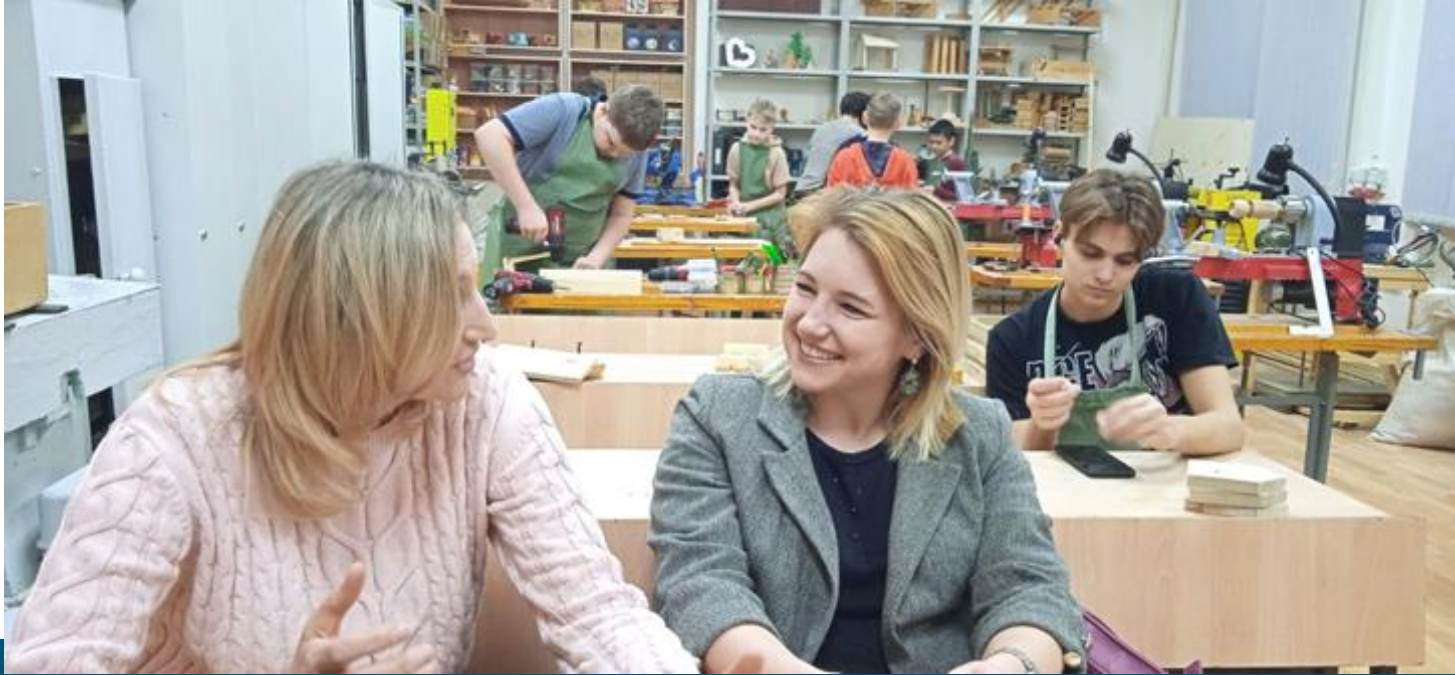
Консультации для родителей